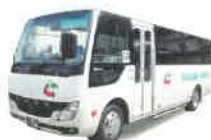
小型マイクロバス 1台